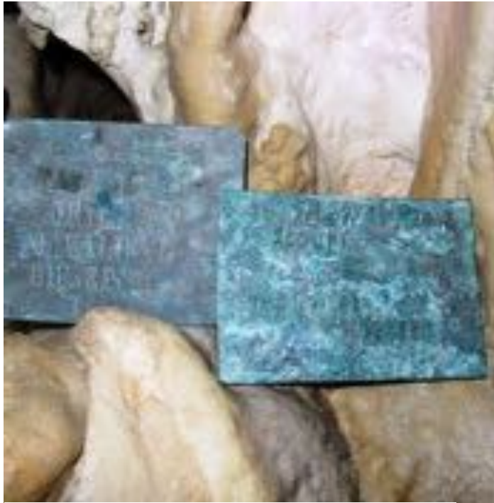
Monte Cucco — Targhe commemorative.