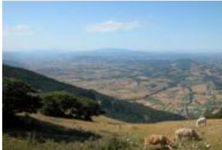
Costacciaro - Monte Cucco

veroso sottolineare che il mancato riconoscimento e remunerazione dei servizi offerti dall'ordinaria e costante gestione forestale, rappresenta da sempre un mancato guadagno a discapito di chi con la quotidiana gestione forestale sviluppa benefici per la collettività. Servizi che vanno dalla regimazione idrica al contenimento dei dissesti idrogeologici fino all'assorbimento della CO2 e non per ultimo anche ad una ottimizzazione dei deflussi idrici che consentono a valle una miglior produzione di energia idroelettrica. Benefici che se adeguatamente remunerati possono far bene sperare in nuovi mercati e nuove opportunità occupazionali in aree montane. A fronte di tale scenario, Federforeste, - sostiene che per attuare al meglio tali politiche l'elemento fondante per lo sviluppo e la crescita del settore forestale non può che essere la possibilità di una gestione delle aree forestali attraverso il concreto ed attivo coinvolgimento dei Residenti. Un modello associativo nella forma di Consorzio Forestale di diritto privato, partecipato dagli Enti Locali, dai residenti e proprietari del Bene Bosco, sia pubblico che privato e naturalmente dai lavoratori e operai forestali. Seppur la programmazione post 2013 è oramai alle