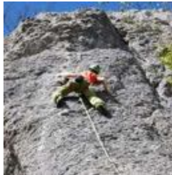
Monte Cucco - Climber.

zione di eventi importanti (e divertenti) come ad esempio il fenomeno "Kukkoblock" di Costacciaro, ormai alla sua seconda edizione. Nomi importanti sono il fulcro di questo movimento, esponenti della Nazionale Italiana di Arrampicata. Possiamo anche vantare una delle falesie più grandi e belle del centro Italia, la falesia di Ferentillo, oltre che molte altre meno conosciute, ma sempre affollatissime, disseminate lungo tutta la fascia appenninica, così da offrire un panorama di ampia scelta per chi vuole praticare questo sport che, una volta assimilato, diventa più uno stile di vita che una semplice, mera disciplina fisica. L'ambiente dell'arrampicata racchiude molte cose, dall'immergersi nella natura, all'affacciarsi su panorami mozzafiato. Ci regala avventure e la possibilità di confrontarci con i nostri limiti spingendo noi stessi a superarli. I suoi luoghi sono ricchi di suggestioni, capaci di elargire importanti insegnamenti a chi la vive con rispetto e crea legami profondi con i propri compagni d'avventura. Inoltre riesce, dall'alto delle sue pareti, a ridimensionare il mondo quotidiano. I problemi visti dall'alto sembrano più piccoli, lontani, la pace della natura ti entra nell'anima infondendo nuove energie e disperdendo nel vento le preoccupazioni. Mentre scali, la mente si svuota e tutta