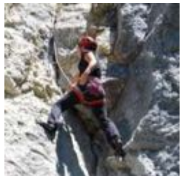
Monte Cucco - Climber.

chiodatura, già presente in parete e risalente ai primi anni '90. Aver individuato posti così adatti a questa disciplina proprio nell'area protetta del Parco del Monte Cucco è particolarmente importante e significativo per un luogo che tenta con tutte le sue forze di creare un'offerta turistica di settore, fatta di piccole nicchie e basata proprio su sport estremi e su frequentatori appassionati. L'arrampicata può contribuire in maniera decisiva ad ampliare un'offerta variegata che può influire considerevolmente sull'economia di un territorio che vede la montagna come una grande ricchezza e su cui ha scommesso per uno sviluppo rispettoso e sostenibile. Per concludere voglio sottolineare il fatto che la creazione delle falesie non richiede grandi spese, i costi per il materiale sono minimi e non necessita di nessun intervento strutturale. L'amore per il proprio sport porta inoltre gli arrampicatori umbri a contribuire in maniera del tutto volontaria alla chiodatura e messa in sicurezza delle pareti. E' quindi un investimento prettamente umano quello necessario alla creazione di un'area che, a livello turistico, potrebbe invece portare tanto al territorio del Parco del M.Cucco e del nostro amato paese, che grazie alla manifestazione "Kukkoblock" è ormai conosciuto nel settore dell'arrampicata presente in tutto il Centro Italia.