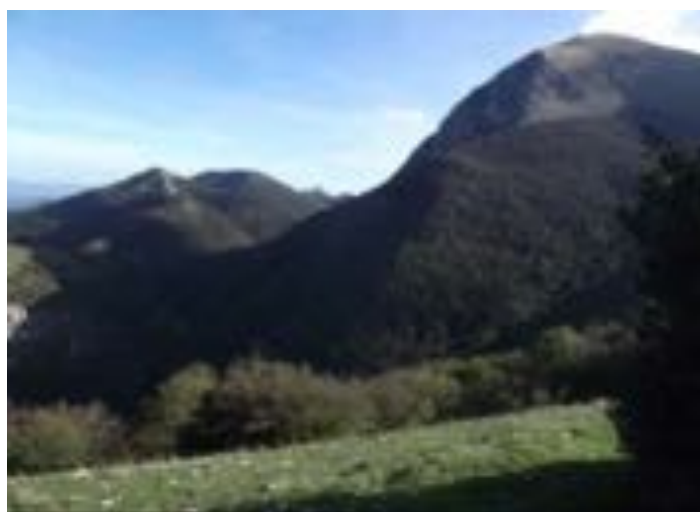
Costacciaro - Monte cucco.

E' stato sempre descritto come un "massiccio", sì, il massiccio del Monte Cucco, come se fosse una montagna gigantesca, aspra, piena di insidie, dirupi e priva di "sentimento". E' proprio del sentimento che parleremo, sì, del sentimento che il Monte Cucco trasmette a chi vi passeggia, per i suoi sentieri, tra faggete secolari e praterie. Sento la necessità di descrivere, con questo mio piccolo contributo, la realtà che ho provato un anno fa circa percorrendo il sentiero che va da Pian delle Macinare fino alla croce posizionata nel 2003 a dorso di mulo, che sembra abbracciare e "proteggere" la comunità di Costacciaro. Una domanda sorge spontanea: ma una montagna, come il nostro Monte Cucco, può far innamorare le persone? Certo che no, ma contribuisce positivamente senza dubbio a far uscire da dentro di noi quel sentimento profondo che c'è tra esseri umani e che si chiama amore. Iniziamo col dire che tutte le stagioni sono buone, non c'è un mese migliore dell'altro, ma tutto l'anno la nostra montagna, ha il suo fascino incantato, il suo valore aggiunto, il suo enorme "contributo" a far sprigionare nei nostri cuori quel sentimento profondo che noi chiamiamo amore.....infatti la