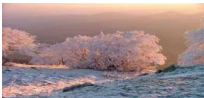
Costacciaro - Monte Cucco sotto la neve.

regalo da questa montagna, piena di colore e calore, ricca sotto vari aspetti paesaggistici, naturalistici, culturali, ecc..... comunque torniamo a noi, la mia esperienza è stata proprio quella di essermi innamorato qui' su questa montagna, e penso (dopo anche le mie considerazioni di cui sopra). Che proprio "lei" (intendo la montagna) mi abbia dato un grosso contributo, come se fosse stato un grosso "catalizzatore" d'amore; senza esagerare penso che sia stato positivo il fatto di scegliere la nostra montagna come percorso di una semplice passeggiata sfociata nel più grande sentimento umano, antico come lo siamo noi. Ora mi rivolgo soprattutto ai giovani che spesso, trascurando queste "sottigliezze", che io personalmente definisco importanti, preferiscono ritrovarsi in una discoteca assordante, invece di "assaporare" la spettacolarità della natura che influisce positivamente su di noi e appunto "aiuta" le persone ad incontrarsi nei cuori. Questo è quasi un invito che faccio, anche alle generazioni future, dicendo di non abbandonare la montagna perché la montagna non vi abbandonerà mai neanche da un punto di vista sentimentale; aspetto quest'ultimo, appunto, di cui non si è mai parlato e invece merita di viverlo. Provate a farci una semplice passeggiata e poi giudicherete voi stessi il risultato. Buon passeggio a tutti.....e in bocca al lupo!!!!